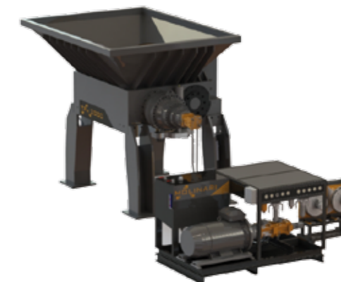
trituratorii monoalbero SERIE TPm