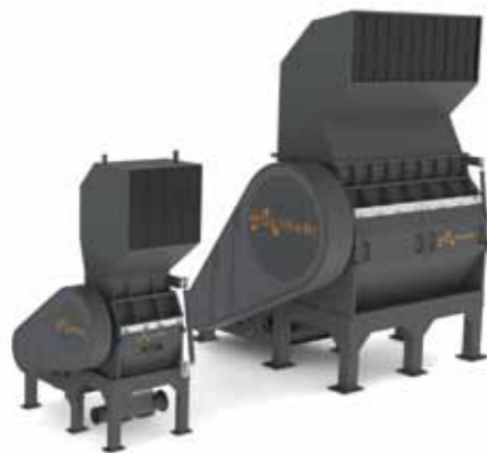
granulatori e raffinatori SERIE MP