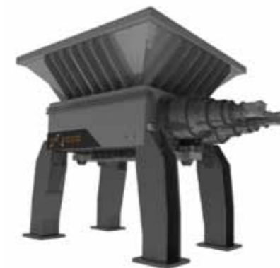
trituratorii primari SERIE TP/hTP