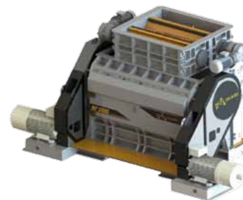
trituratorii secondari SERIE MT